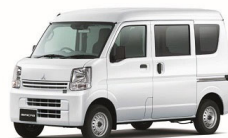
ミニキャブ バン M グレード除く