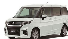
デリカ D:2 全グレード