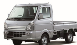
ミニキャブ トラック G