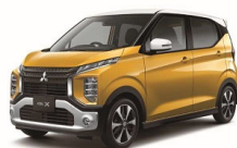
eKクロス 全グレード ※