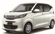
eKワゴン 全グレード ※