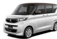
eKスペース 全グレード