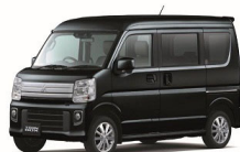
タウンボックス 全グレード