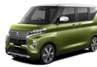
eKクロス スペース 全グレード