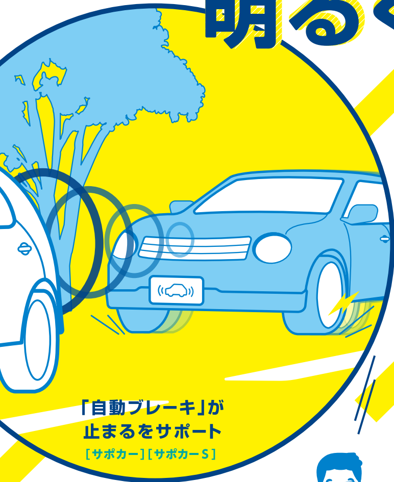
「自動ブレーキ」が 止まるをサポート [サポカー][サポカー-S]