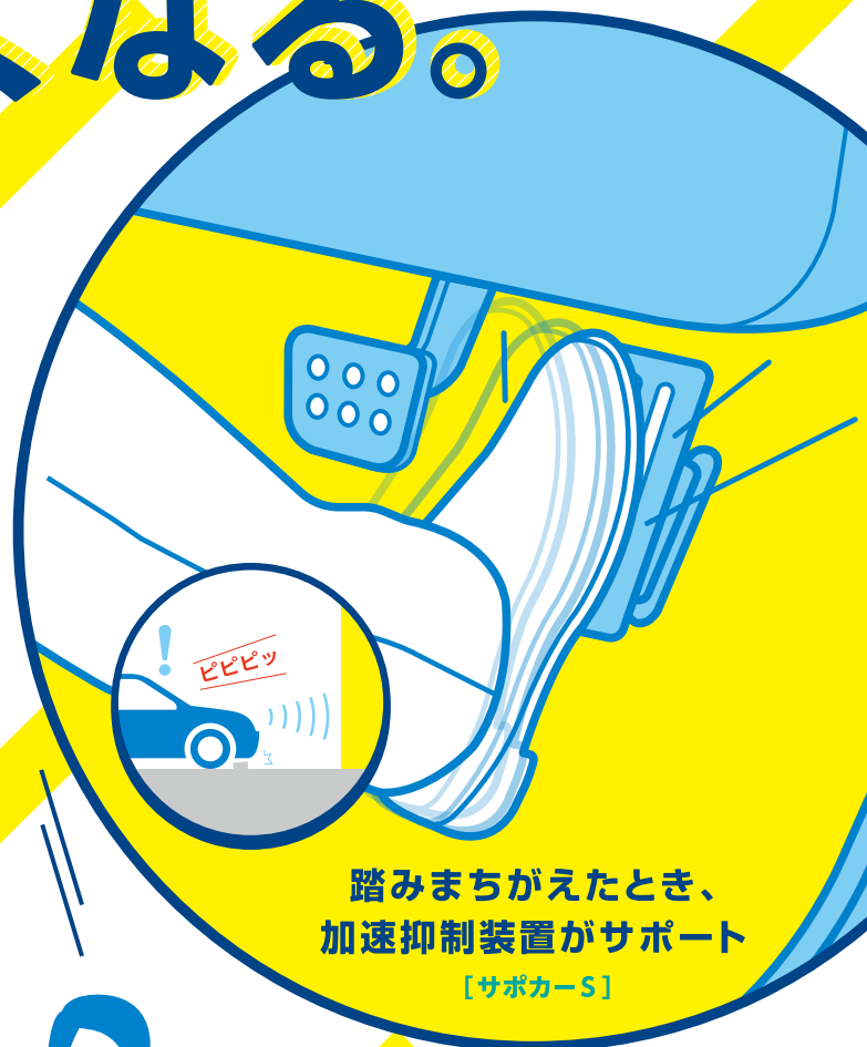
踏みまちがえたとき、 加速抑制装置がサポート [サポカー-S]